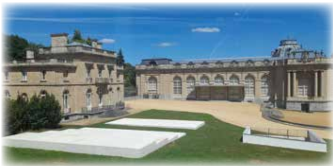
Museum für Zentralafrika in Tervuren.