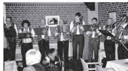
1996 - 40 Jahre Posaunenchor