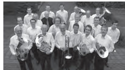
2006 - 50 Jahre Posaunenchor