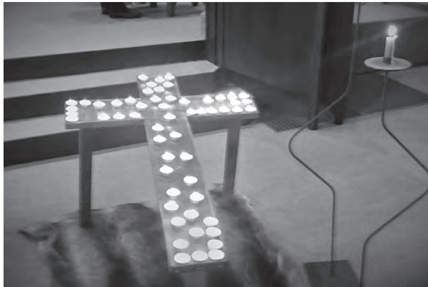
Kerzenkreuz im Auszeit-Gottesdienst

Wir vom Gemeindebrief-Redaktionsteam wollten es genau wissen und haben bei den Auszeitbesuchern nachgefragt: „Worin liegt der Reiz der Auszeit, aus welchem Grund besuchen Menschen diesen Gottesdienst?“