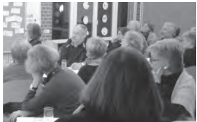
Intensiv besprochen und betrachtet wurden die Gedanken und Ideen zum Thema Reformation im „Café miteinander“