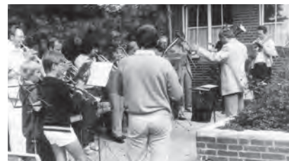
1989 - Gemeindefest in Olfen