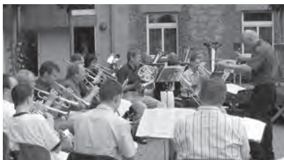
2003 - Himmelfahrt auf Karthaus