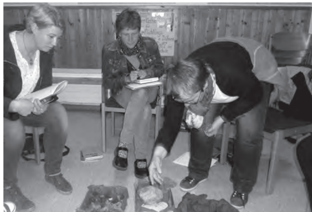
Kindergottesdienstvorbereitung im Gemeindezentrum