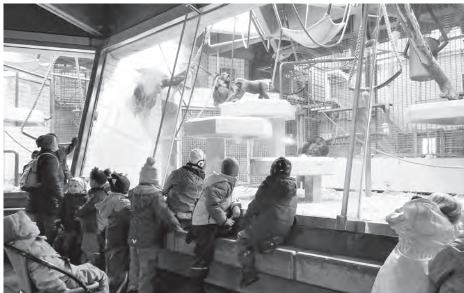
Ein Besuch im Zoo: „Wir haben auch Gorillas gesehn, die sich gezankt haben, mit ner Banane.“

Zum Schluss haben wir uns wieder in Kreis gesetzt in der Turnhalle, und wir haben schon wieder das Mama-Lied gesungen.“