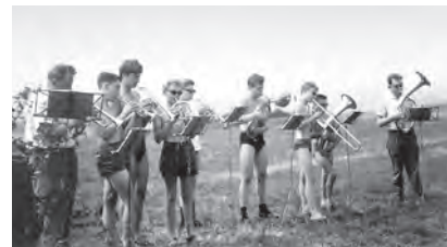
1964 - Bläserfreizeit