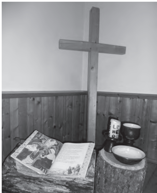
Kindergottesdienstraum im Gemeindezentrum