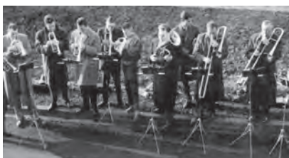
1957 - Ein erstes Ständchen