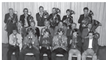
1976 - 20 Jahre Posaunenchor