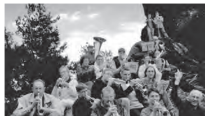
1993 - Bläserfreizeit in Quedlinburg